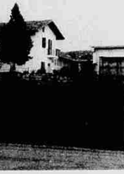
La casa a Castelletto Merli dove la giovane impiegata viveva con i genitori